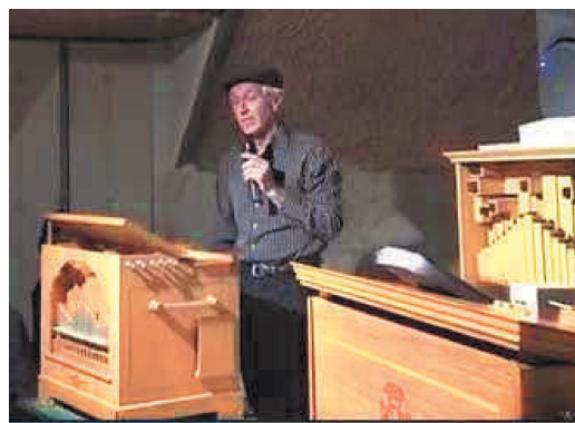
Comme de bien entendu