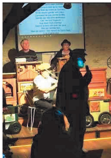
Mon amant de Saint Jean