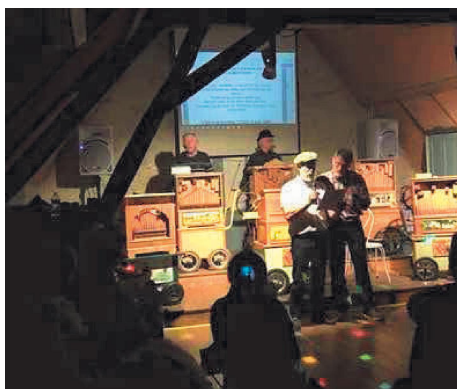
La Java Bleue